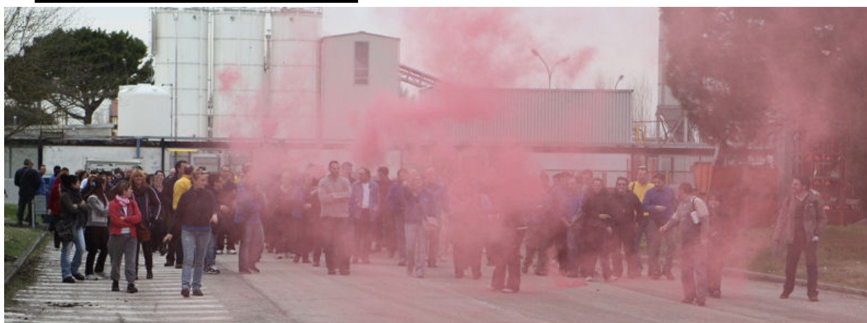
Nella foto lavoratrici e lavoratori Electrolux in sciopero contro i licenziamenti (17 marzo 2010)

Hanno diritto a votare per il rinnovo della RSU tutti i lavoratori, anche coloro che al momento sono assenti a vario titolo (maternità, aspettativa, malattia, infortunio, congedi di altra natura).